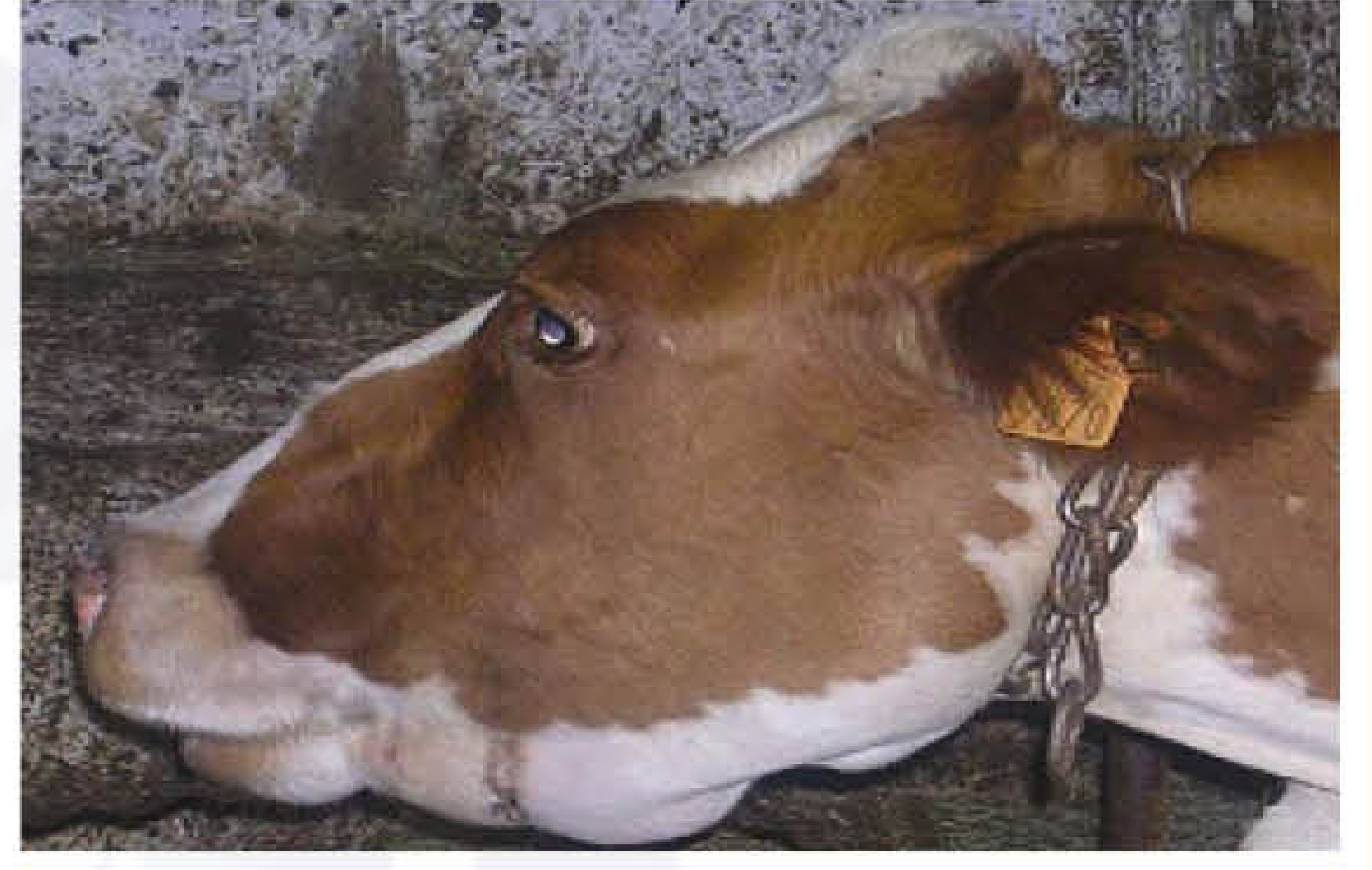
गले के नीचे सूजन