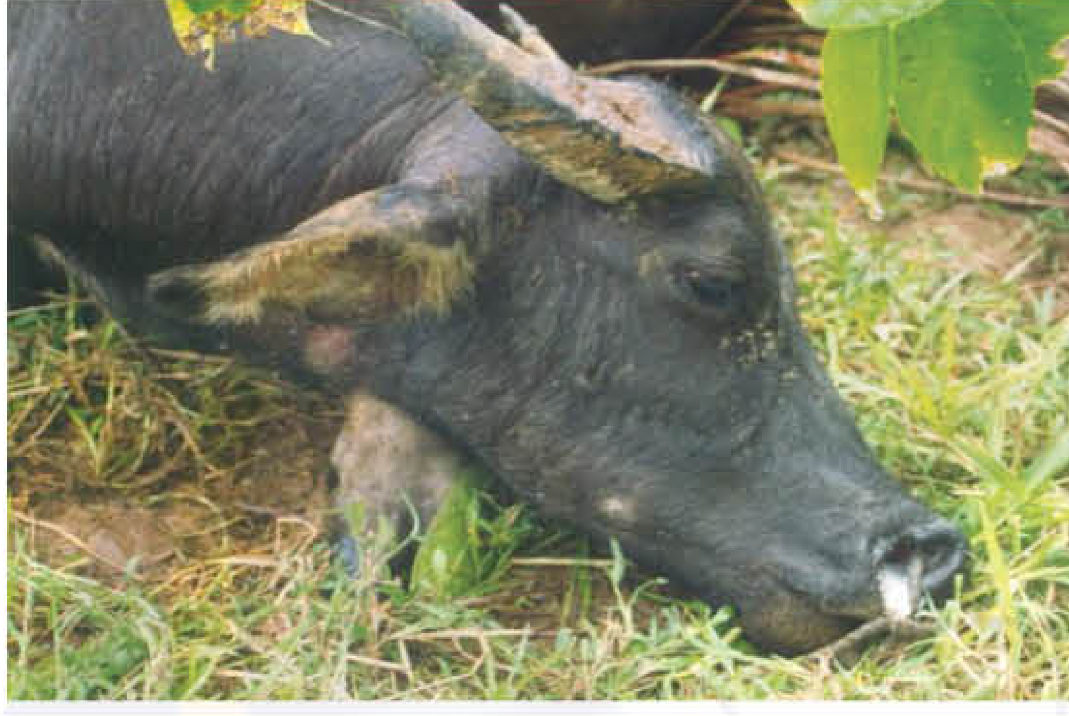
नाक से स्राव