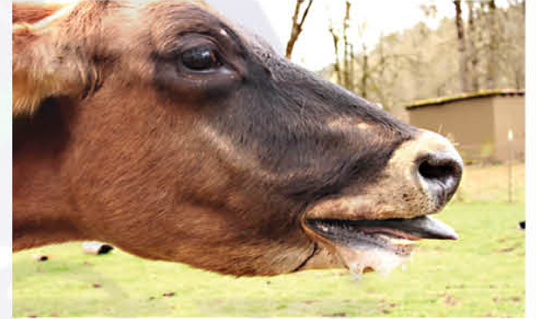
सांस लेने में तकलीफ